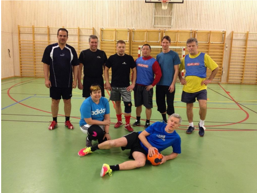
Trafikverket och Svevia spelar fotboll på fredagar.

Under 2014 har vi spelat inomhusfotboll i Gerestaskolans sporthall på fredagar kl 16-17. Liten hall med små spelytor har tagit oss alla till en högre nivå tekniskt sett. Under sommarmånaderna har vi spelat utomhus på "KA5-planen". De flesta passen har haft bra uppslutning med 8 till 14 spelare. Merparten av deltagarna kommer från Trafikverket och från Svevia som vi delar hyrestiden med.