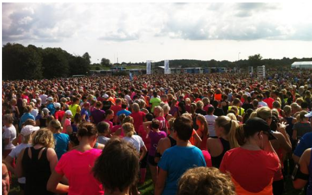
30 000 tjejer med spring i bena.

På Tjejmilen 2014 var vi inte fullt så många som deltog. Vi var bara sex tjejer från vår förening som alla förtjänstfullt, tog sig runt den 10 km härliga banan på Gärdet och Djurgården. Som vanligt har vi vårt eget förnämliga tält där vi förvarar våra saker, får våra "sargade" kroppar masserade, både före och efter loppet, om man så önskar. Där sammanstrålar alla tjejer från norr till söder och som vanligt våra finska kollegor från öster. Och så är det, vi strålar, solen strålar och det är lika roligt varje gång vi träffas.