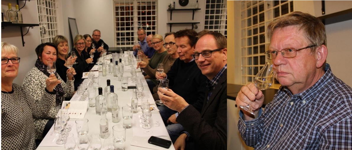
Nu tar vi den, nu tar vi den.

Hernö Gin tilldelades flest medaljer när Gin Masters 2013 arrangerades i London under slutet av juni 2013. Tävlingen genomfördes genom individuella blindtest och totalt deltog 49 ginvarumärken. Hernö Gin tilldelades två Guld och ett Silver medan Hernö Navy Strength Gin tilldelades två Master.