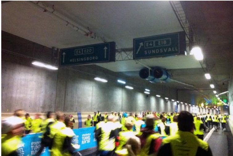
Följ pilarna i Norra länken mot Sundsvall

I Lidingöloppet som har flera olika klasser, var det tre tappra medlemmar från föreningen som sprang. En del sprang loppet på vår fina bro i Sundsvall och några sprang invigningsloppet i Norra Länken. Det blev inget deltagande i Indalsledenloppet 2014, men vi gör ett nytt försök 2015. Inbjudningar kommer kontinuerligt om olika lopp, så håll ögonen öppna.